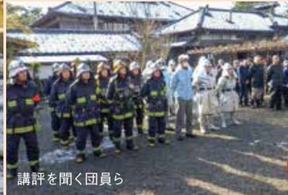
講評を聞く団員ら