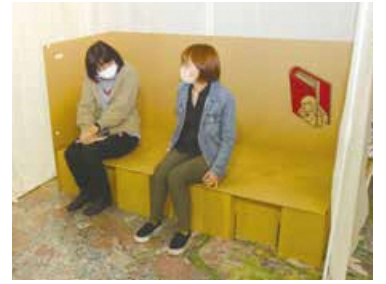
段ボールベッドなどの防災用品