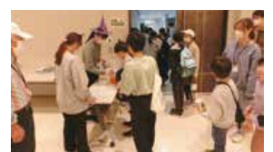
公民館事業でのボランティア