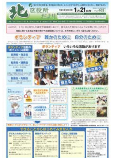
1月21日号 北区役所だより