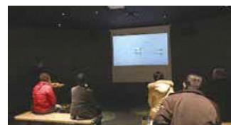
水の駅「ビュー福島潟」視察