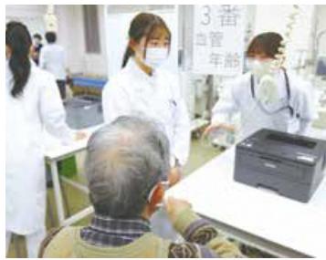
↑「あなたのための健康講座」の様子