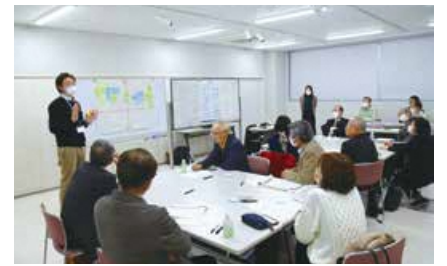
自治協議会提案事業について意見交換(ワークショップの様子)