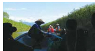
船から福島潟を巡る、潟料理に舌鼓