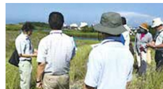
北地区を巡る(ひょうたん池、島見浜海水浴場)