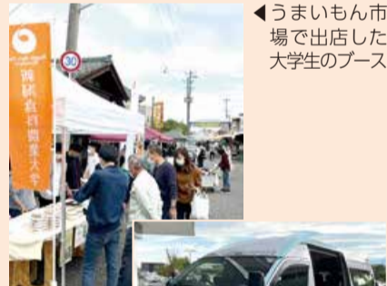
◀うまいもん市場で出店した大学生のブース