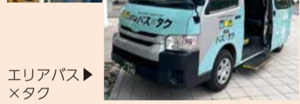
エリアバス ▶ ×タク