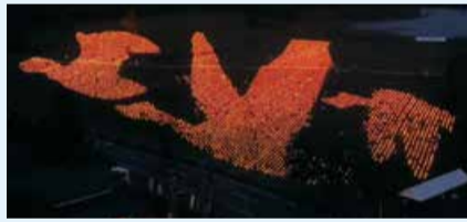
▲福島潟自然文化祭 雁迎灯