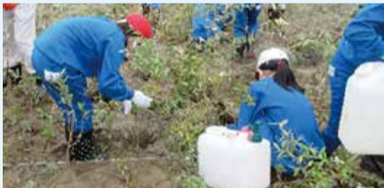
▲松浜海岸でのアキグミの植栽