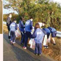
地域住民などによるクリーン活動▼