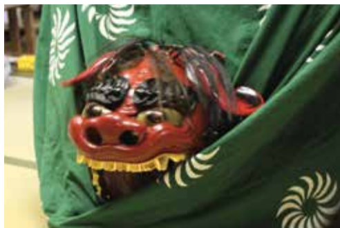
まさゆき 正尺の神楽

江戸時代から舞われていましたが、明治35・36(1902・1903)年に中止したところ、村に悪病が流行しました。人々は、「原因は神楽があるのに舞わないでいるためだろう」と考え、再び舞うようになったそうです。