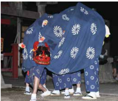
おおせやなぎ 大瀬柳の神楽

一説には、天保13(1842)年9月の1カ月足らずの間に村で5・6人が亡くなる悪病が流行したため、旅人が「悪魔払いをしなければならぬ」と神楽を教え、始まったといわれています。