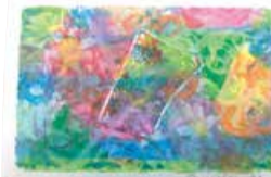
オイルパステルでさまざまな色の線を書いてみよう