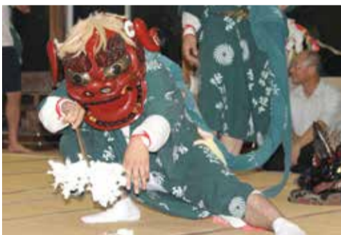
うちぬま 内沼の神楽

一説には、天保13(1842)年9月の1カ月足らずの間に村で5・6人が亡くなる悪病が流行したため、旅人が「悪魔払いをしなければならぬ」と神楽を教え、始まったといわれています。