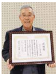
みどり区 神田自治会長