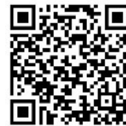
予約サイト二次元コード