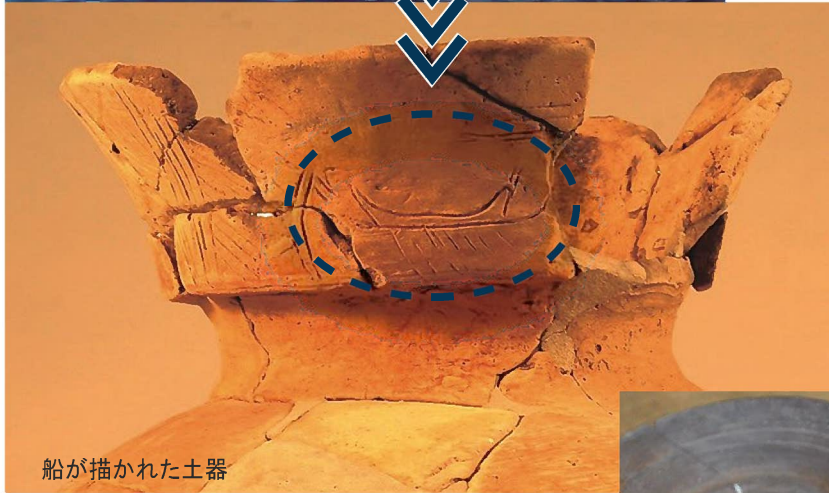
船が描かれた土器