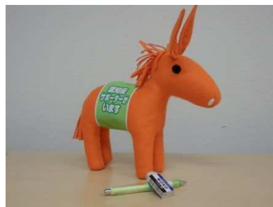
【ロバ隊長ぬいぐるみ】