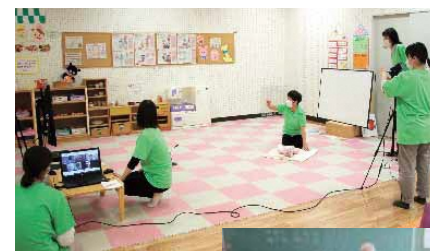
ウェブを活用した子育て支援講座

人々が学び合い、交流することは、個人の生きがいづくりのほか、地域の輪を広げ、地域課題の解決へのきっかけづくりにもなります。生涯学習や交流機会の充実を図るとともに、多様な団体と連携し、地域を支える人材の育成を図ります。