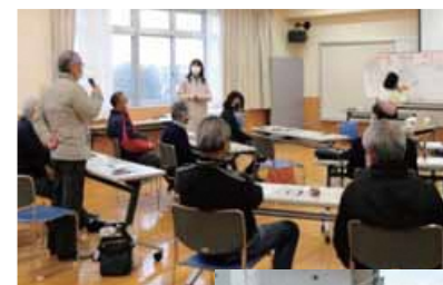
地域住民、大学生、NPO法人が連携してまちづくりを考えるミーティング

自治会・町内会、地域コミュニティ協議会、区自治協議会など、住民自治を担う団体や、地域で活動する多様な団体の活動を支援するとともに、団体間の連携を促進し、互いに知恵を出し合い、持続可能な形で地域課題を解決できる力を培います。