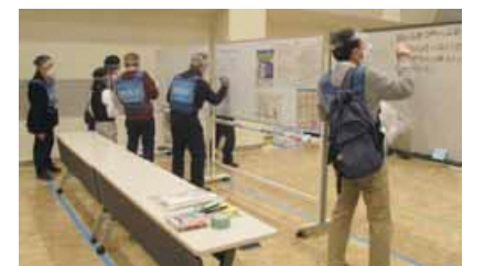
災害時の避難所運営を想定したワークショップ

社会情勢の変化や多様化する住民ニーズに対し、適切なサービスを着実に提供します。また、正しい情報、必要な情報の発信と丁寧な広聴の充実に努めます。