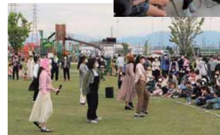
寺山公園での大学生と子どもたちの交流