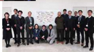
産業観光の進展に向けた産学官連携の取り組み