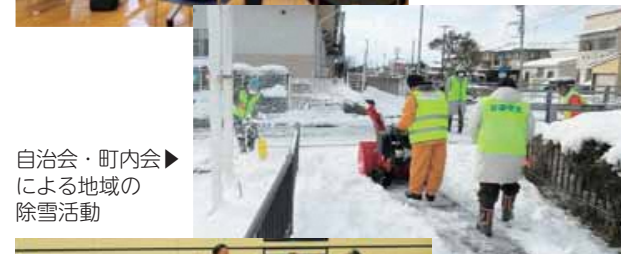
自治会・町内会による地域の除雪活動