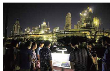
産業のまち東区の魅力を感じていただける工場夜景バスツアー

新潟空港と新潟西港（山の下埠頭）という拠点に加え、海や川、潟などの水辺空間が多くある東区の特徴を活かしてにぎわいを創出することで、活気あるまちをつくりまします。