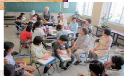
公民館等で行われる世代間交流の取り組み