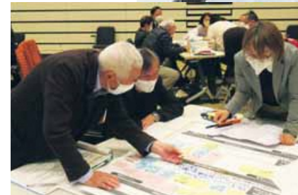
地域課題の解決を目指す区自治協議会