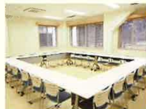
会議室1 窓が大きく、 明るい部屋