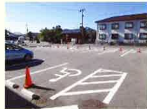
駐車場26台 1台分は 障がい者用