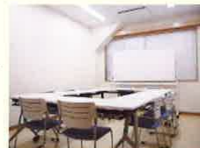
会議室3 少人数で 使いやすい