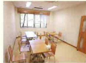
フリースペース 利用者の 憩いの場