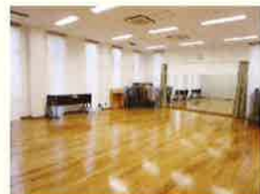
ホール 連結して 利用可能