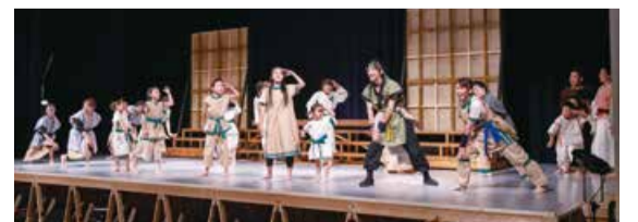
令和3年度公演の様子