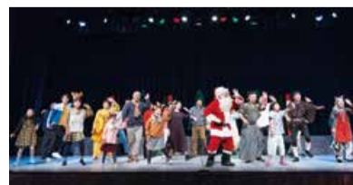
令和2年度公演の様子