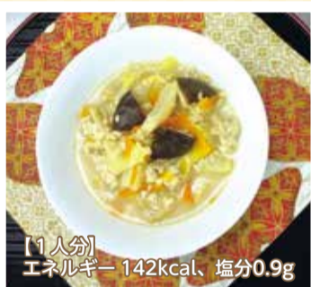
[1人分] エネルギー 142kcal、塩分0.9g