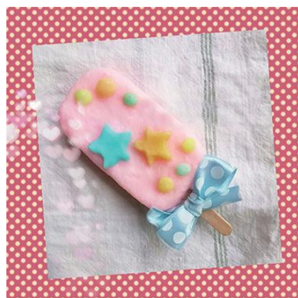
きらきらチャレンジ作品例

8月19日(水)午前10時~正午... 小学生先着10人... ハンドタオル、エプロン、飲み物