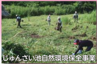
じゅんさい池自然環境保全事業