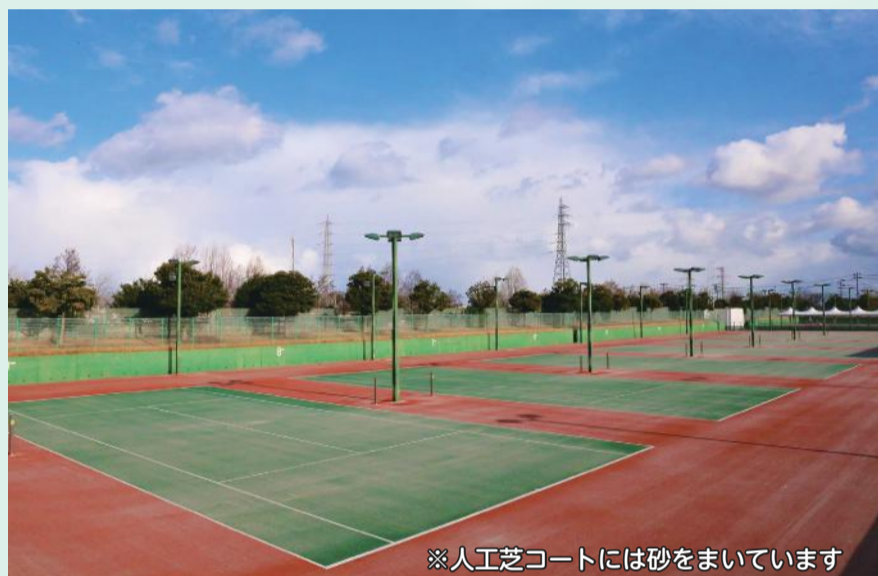
※人工芝コートには砂をまいています

砂入り人工芝張替工事のため休館していた市庭球場(江口)が4月1日より開館します。16面全面の芝が新しくなり、色もグリーン(内側)とブラウン(外側)に変わり、ボールのイン、アウトが見やすくなりました。新しくなった庭球場でプレーしてみませんか。