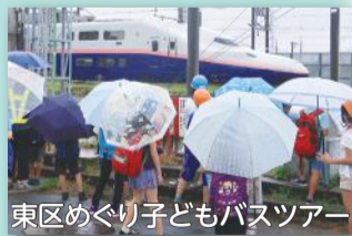
東区めぐり子どもバスツアー