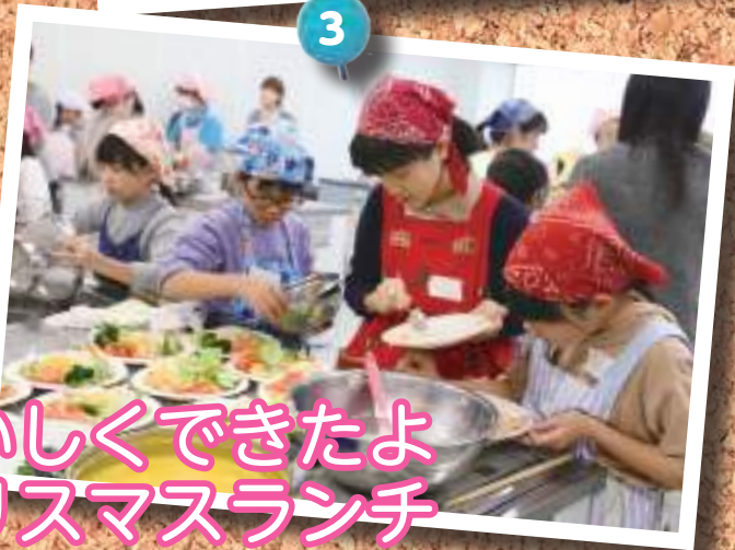
3 おいしくできたよクリスマスランチ