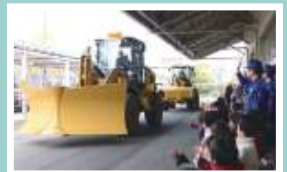
除雪出動式の様子