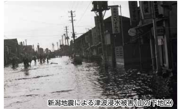
新潟地震による津波浸水被害(山の下地区)