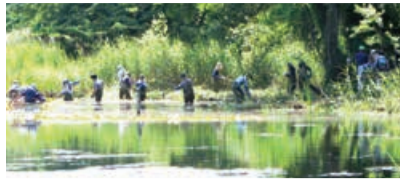
昨年度の保全活動の様子