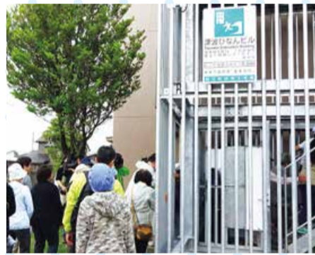
津波避難訓練の様子(船江地区)

災害時には、ご近所の皆さんの協力や助け合いが欠かせません。地域で行っている自主防災訓練に積極的に参加しましょう。訓練を行う際には、各地域コミュニティ協議会の地区内で1人以上が資格を取得している「防災士」をご活用ください。