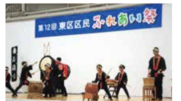
昨年のステージ発表