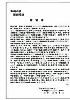
提出された要望書

中央消防署跡地に我が新潟コミュニティ協議会事務所や、ひまわりクラブを入れて総合ビルの建物を2回の要望書でお願いしてきましたが、未だ回答がありません。我がコミ協は、早く地域の皆様に喜ばれる施設を造って頂けるよう3回目の要望書を、12月19日に、市長及び中央区長に提出致しました。