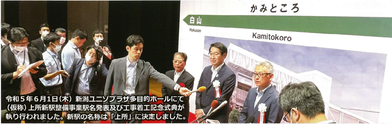
令和5年6月1日(木)新潟ユニゾプラザ多目的ホールにて(仮称)上所新駅整備事業駅名発表及び工事着工記念式典が執り行われました。新駅の名称は「上所」に決定しました。