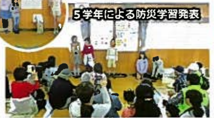
5学年による防災学習発表