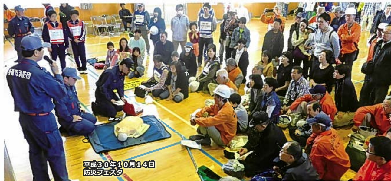
平成30年10月14日 防災フェスタ