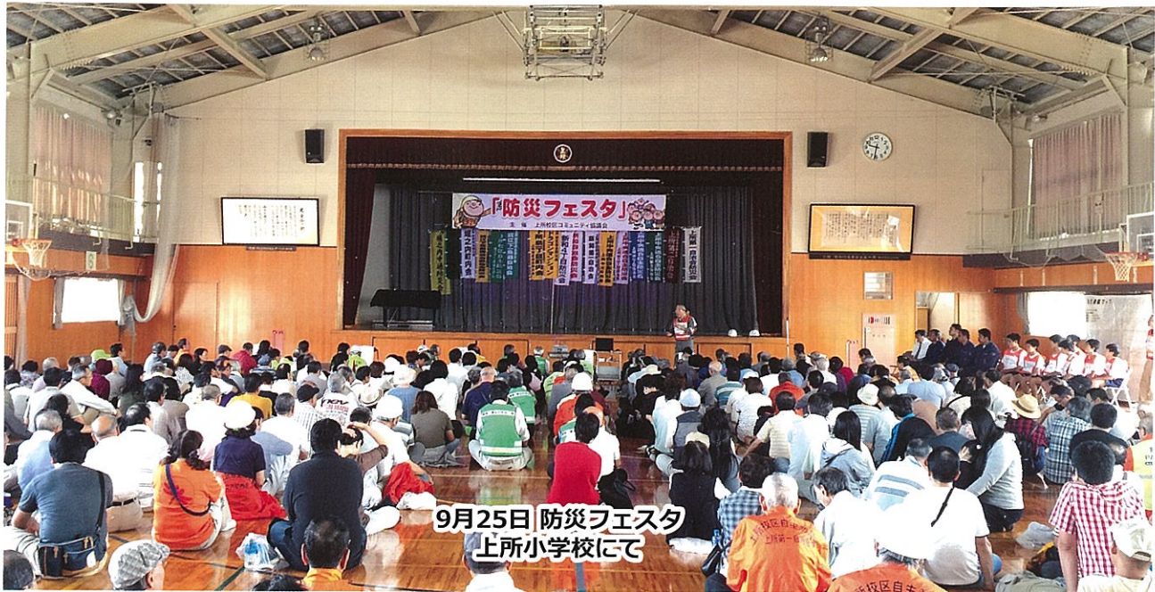
9月25日 防災フェスタ 上所小学校にて