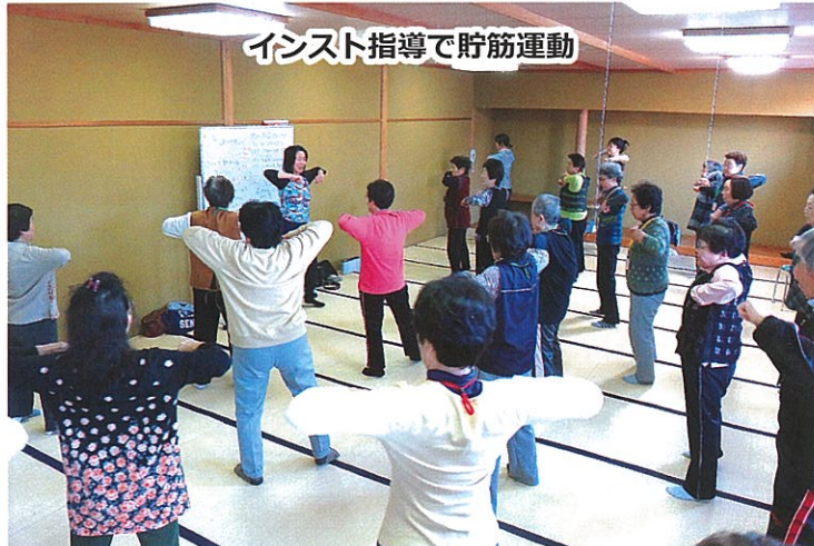
インスト指導で貯筋運動