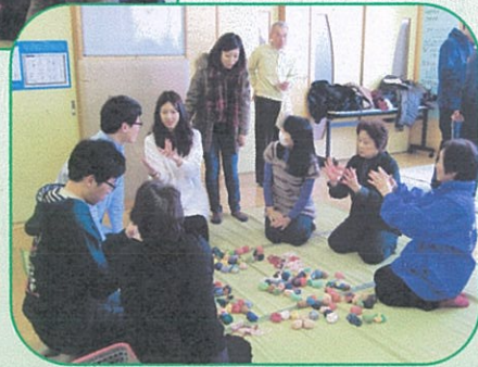
午後の部の「お話し」