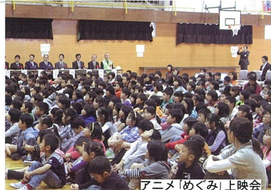
アニメ「めぐみ」上映会

当日は県会・市会の議員、拉致対策の県・市の担当者、警察等の来賓を含め総勢350人強の方々が参加されました。NHKや新潟日報の取材もあり、入舟小学校が人権教育研究指定校として大いにアピールできたと思います。当会はこの企画を通して、今後も北朝鮮による拉致問題の早期解決を祈り続けて行きたいと思っています。