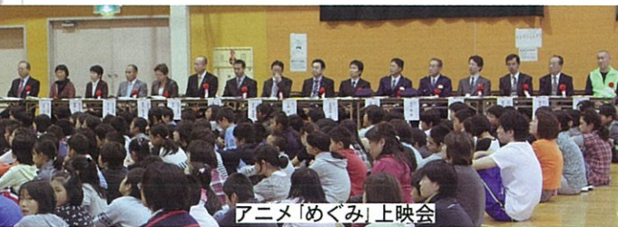
アニメ「めぐみ」上映会