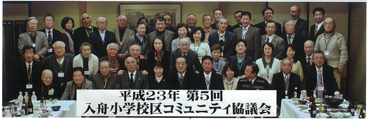
平成23年 第5回 入舟小学校区コミュニティ協議会