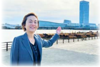
20歳のつどいを開催する朱鷺メッセと、区長

また、中央区では重点事業として「日和山浜魅力創出事業『ハマベリング!!!』」に取り組みしています。日和山浜に近接する西海岸公園において駐車場の整備や公園遊具の新設が整い、大きな変化を感じていただけるようになります。令和6年度をグラウンドオープンとして浜辺と公園を一体的に活用し、さらなる魅力を賑わい創出を図ってまいります。