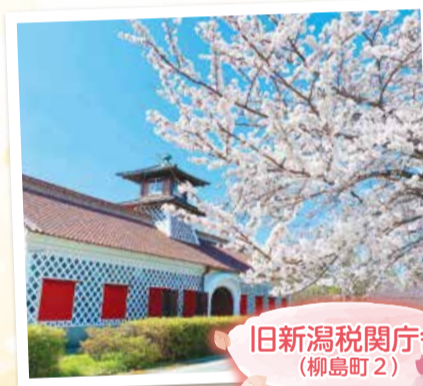
旧新潟税関庁舎 (柳島町2)

暖かな日差しを感じながらお散歩したくなる季節。お花見にぴったりの桜が見られるスポットをご紹介します。