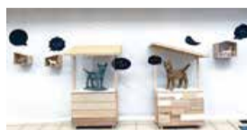
タマ公に憧れるたまさん 古町通6