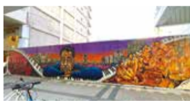
デューク・エリントン ミュージカルアート 古町通6

古町の商店街ではいたるところにアート作品が見られます。探しに出かけてみましょう。