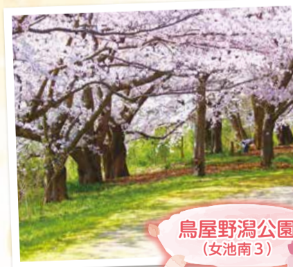
鳥屋野潟公園 (女池南3)