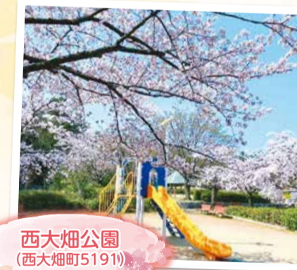
西大畑公園 (西大畑町5191)