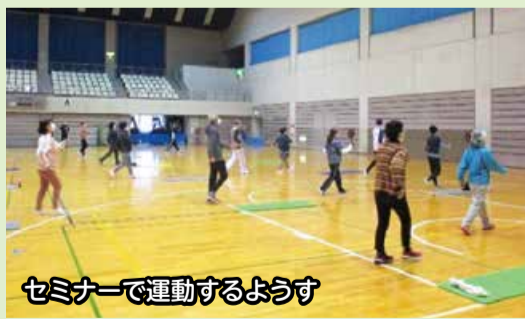
セミナーで運動するようす

☎あす3日(月)から17日(月)までに電話で健康福祉課健康増進係(☎223-7246)へ