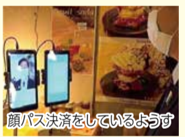
顔パス決済をしているようす

グローリー株式会社は、今年1月に「先端技術を活用した『無人店舗』プロジェクト」として顔認証による「顔パス決済」サービスの実証実験を行いました。「顔パス決済」とは、店舗に設置された専用のタブレット端末に顔をかざすだけで決済が完了するサービスです。