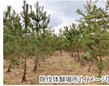
除伐体験場所(イメージ)

海岸林として生育してきたクロマツの密度管理を目的に除伐を実施します。枝切作業は小学生でも可能! ☎10月13日(木)・14日(金)・15日(土) 全日2回制 ①午前10時~11時、②午後3時~4時 ☎場市営汐見台団地跡地(浜浦小学校と日本海の間) ☎申10月11日(火)までに参加者全員の氏名・電話番号・住所、車使用の有無を記入し、建設課(メール kensetsu.c@city.niigata.lg.jp)へ ☎同課まちづくり係(☎223-7410)