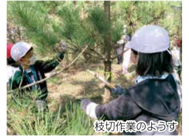
枝切作業のようす