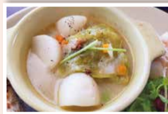
イタリアンレストラン「IFE」で提供されたメニュー「ロールキャベツと寄居かぶのクリーム煮込み」