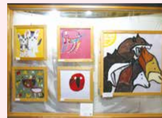
喫茶店nid(ピア万代内)での展示作品