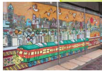
ニイガタ2km 作/しゅんすけ (旧新潟三越横)