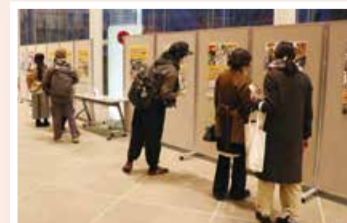
ロビーで実施された「がたふえす」特別企画。歴代ポスターなどの展示に、多くの人が見入っていました。