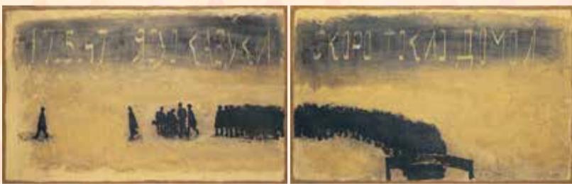
香月泰男《点呼》(2点組)1971年、山口県立美術館蔵 ※シベリア・シリーズ

回 令和3年11月27日(土)～令和4年1月23日(日)まで 観覧料 当日 一般1,000円 大学・高校生800円 中学生以下無料 ※11月26日(金)まで前売券発売中 一般800円 ※会期中は、本展の観覧券で「コレクション展」も観覧可。 画家・ かづやすお 香月泰男(1911-74)新潟初の大回顧展。太平洋戦争と抑留の体験を描いた代表作「シベリア・シリーズ」全57点は、極限状態の苦しみや、鎮魂と望郷の想い、そして、戦地でも失わなかった画家としての眼差しが刻まれ、今なお深い衝撃と感動を呼び起こします。