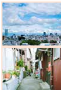
片桐悠太 (フォトグラファー)

オフィシャルサイト 公開しました! SNSやYouTubeチャンネルはこちらから。サイト内では片桐さんの写真も公開中!