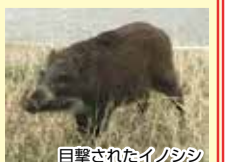
目撃されたイノシシ