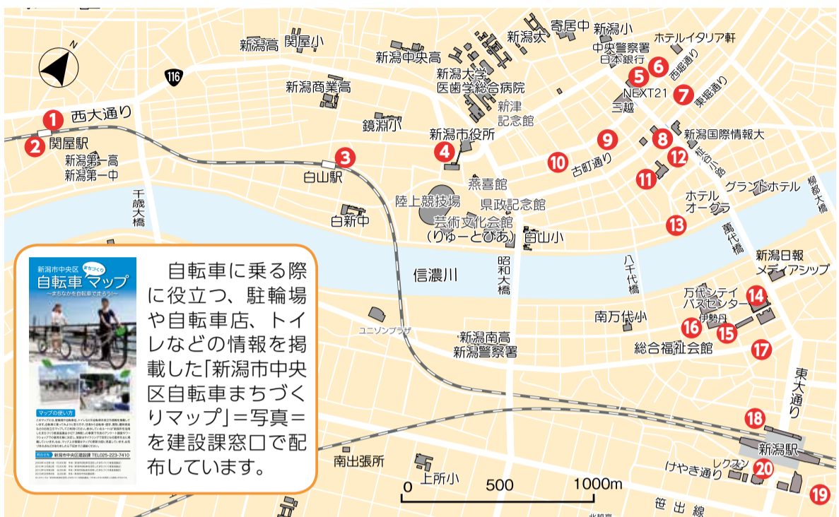
※地図中の数字は下の表に対応。特記のない駐輪場は終日利用可能、利用料無料。

区では、自転車を利用する人が多い場所に駐輪場を整備しています=右地図参照=。歩道などに自転車を止めると、歩行者や車両の通行を妨げるだけでなく、緊急時の避難などにも支障をきたします。駐輪場の利用をお願いします。 建設課(☎223-7403)