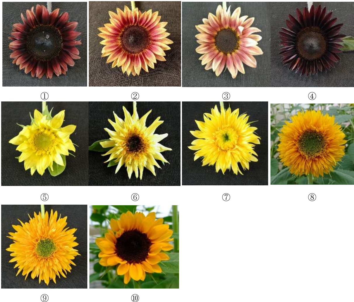
図1 供試品種花写真（①プロカットレッド、②プロカットプラム、③ルビーイクリプス、④ムーランルージュ、⑤レモンオーラ、⑥レモンエクレア、⑦レモネード、⑧東北八重、⑨マティスのヒマワリ、⑩ビンセントネーブル）

草丈は赤花系ほどではないが、4~6月播種区で100 cm以上の切花長が得られる品種が多かった。7月播種区では全体的に短くなる傾向にあったが、レモンオーラとレモンエクレアは70~80 cmと特に顕著であった。