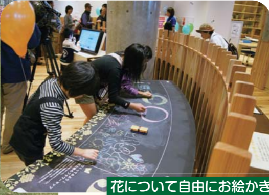
花について自由にお絵かき