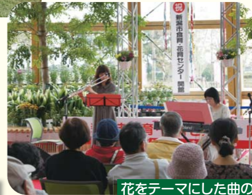
花をテーマにした曲の生演奏に癒されました