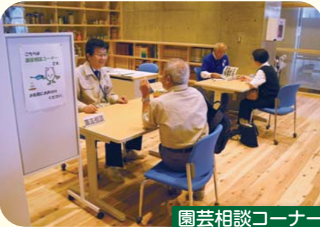
園芸相談コーナー