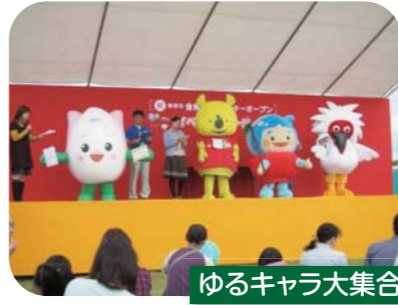
ゆるキャラ大集合