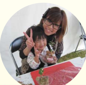
上手にできたよ、ピース