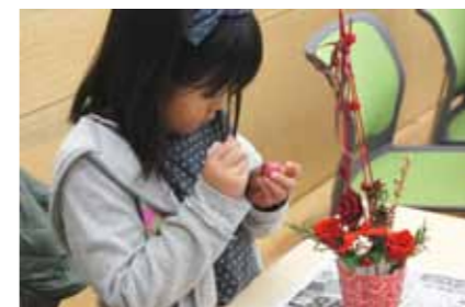
細かい作業も慣れてきました