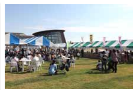
地産地消フェアで新潟の食を満喫