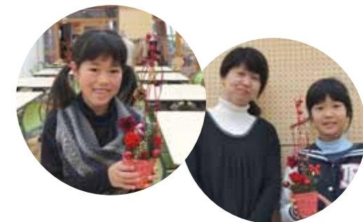
それぞれの個性を感じる作品ができました