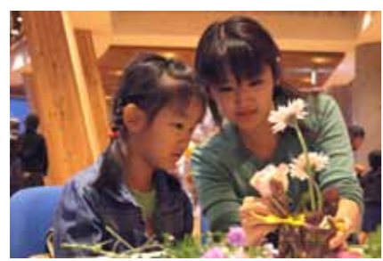
フラワーアレンジ体験