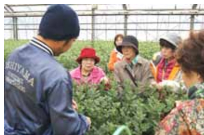
東区のキクの生産者から説明

市民と産地の交流を深めるバスツアーを開催。キクやユリなど生産者の畑を見学したり、中央卸売市場で農水産物流通の仕組みを学びました。さらに出荷が始まった梨「新興」の選果風景を視察し、実りの秋を堪能したツアーでした。