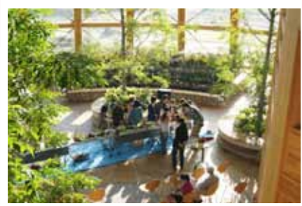
アトリウムの季節の花に囲まれて 寄せ植え講座