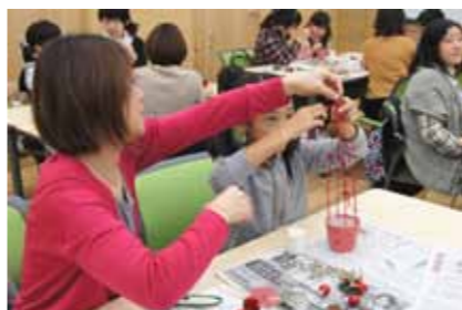
プリザーブドフラワーや木の実で飾ります

親子で一緒に作るので、小さなお子様も安心な人気講座です。 12/1(土)に開催し、24組の親子が参加しました。