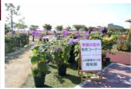
季節の花の直売コーナー