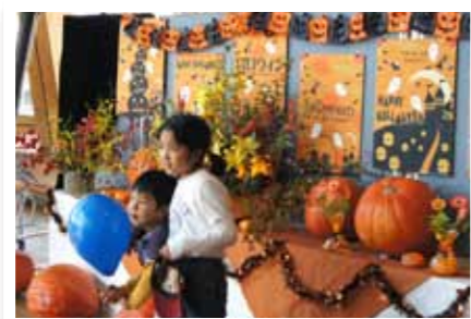
巨大かぼちゃの展示にびっくり