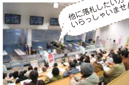
花のセリを模擬体験