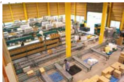
梨(あり)の実館の選果風景