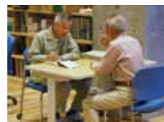
園芸相談コーナー 食育・花育センター1F