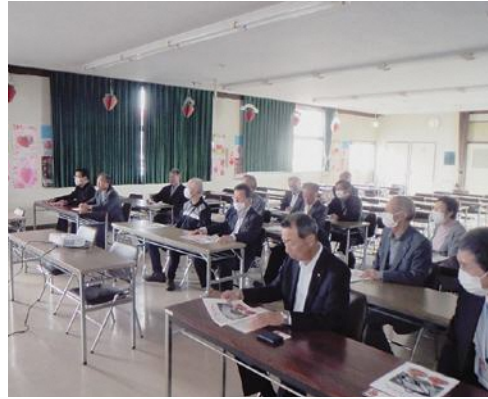
栃木県農業試験場 いちご研究所

11月7日～8日に、栃木県栃木市の栃木県農業試験場いちご研究所及びカネコ種苗株式会社にてさだ育苗農場を視察しました。