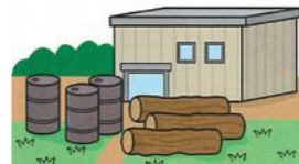
資材置き場にする時