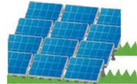
太陽光発電施設を設置する時 など