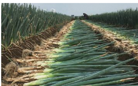
収穫期を迎えたねぎ