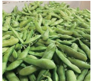
緑が映えるえだまめ

※GI (地理的表示保護制度) 地域には、伝統的な生産方法や気候・風土・土壌などの生産地等の特性が品質等の特性に結び付いている産品が多く存在しています。これらの産品の名所を知的財産として登録し、保護する制度が「地理的表示保護制度」です(農林水産省HPより抜粋)