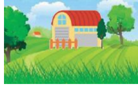
農業用施設を建てる時