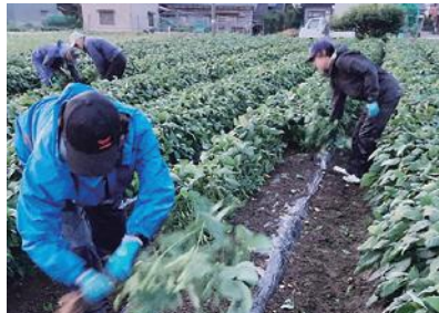
鮮度の良さは早朝収穫