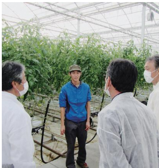
アグリステーション誠和

11月9日～10日に、栃木県下野市にある栽培技術施設アグリステーション誠和及び日光市にある農産物施設の日光街道二二二本陣を視察しました。