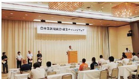
チャレンジフェアの様子

8月27日に、新潟東映ホテルで、農林業新規就農・就業チャレンジフェアが開催されました。