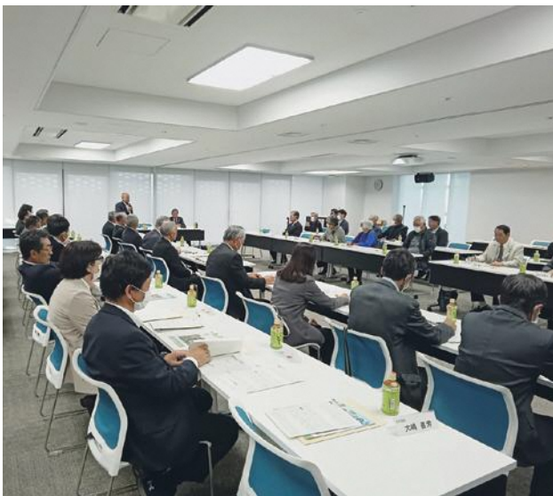
深谷市農業委員会との意見交換会

また、JA花園の農産物直売所では、事業概要・成果・課題などを聞くことができ、農業・食と花に力を入れている新潟市にとって非常に参考になりました。