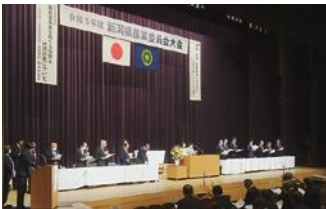
新潟県農業委員会大会の様子

農業委員及び農地利用最適化推進委員として、長きにわたる本市の農業に貢献いただきました。受章された皆さまおめでとございます。