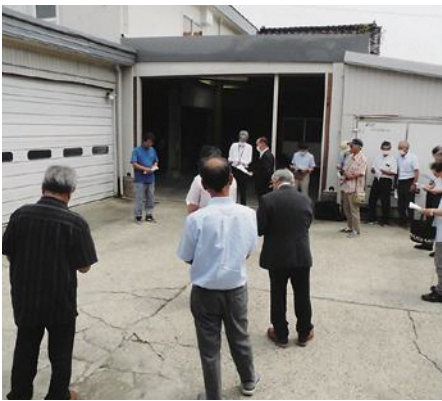
(有) ドリームファーム

食の安全と環境保全に取り組み農場に与えられる認証を取得している勢いのある優良な法人だと感じました。