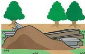
建設残土の捨場にする時