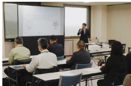
稼ぐ農業実践講演会の様子

11月29日に、秋葉区産業振興課の主催による「稼ぐ農業実践」と題し講演会が開催されました。