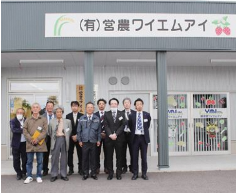
(有) 営農ワイエムアイ

今後は、ドローンを導入し、スポット的に効率よく施肥を行うことを目指しています。積極的な取り組みを行う魅力のある生産法人だと感じました。