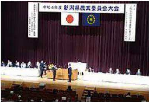
新潟県農業委員会大会の様子

農業委員及び農地利用最適化推進委員として、長きにわたり本市の農業に貢献いただきました。受賞された皆さまおめでとうございました。