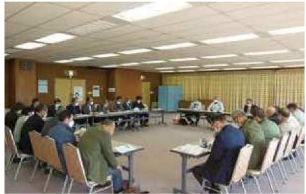
(有)信州うえだファームと意見交換

担い手が減少する中、地域の受け皿として意欲的に取り組んでいる姿を見て、今後の活動や取り組みを進める参考になりました。