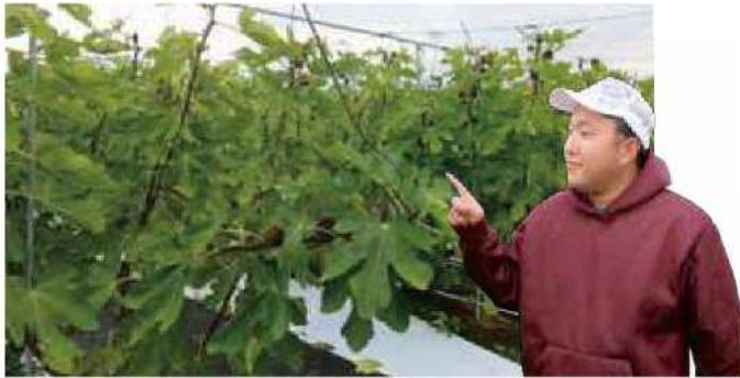
1本ずつ枝を糸でつるす作業が大変です。

水稲や野菜と違い、果樹はやめると農地の処理が非常に大変です。そのような方たちの受け皿になれるよう、自身の技術を上げて地域の信頼を得られるよう頑張りたいです！