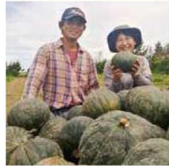
自慢のカボチャの前でほっこりと