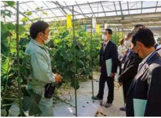
キュウリの生産実証ハウス

マツモトでは、西区特産の長ネギの根葉切りや太さにより選別をする機械の実演展示。エダマメ関連機械の説明もあり、部品の調達や改善要望など意見交換をして有意義な研修となりました。