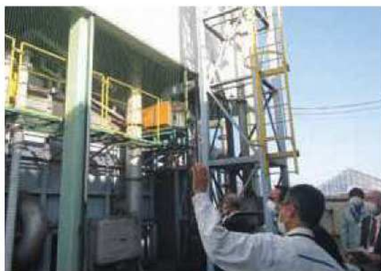
JAIみず野 もみ殻循環施設