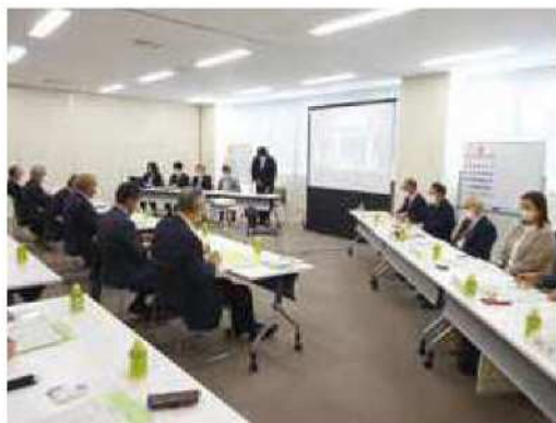
秋田市農業委員会との意見交換会

秋田市農業委員会とは、タブレットを利用した最適化活動や新規就農者について、意見交換をしました。また、ハウス104棟にも及び園芸メガ団地(トマト)では、事業概要、成果、課題などを聞くことができ、園芸に力を入れている新潟市にとって、非常に参考になりました。