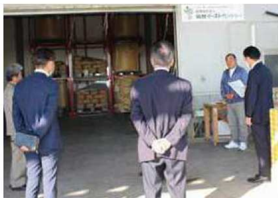
(農)仙台イーストカントリー