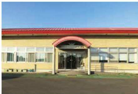
栃木県農業試験場 いちご研究所

また、各所の直売所は、観光の拠点にもなっているため、集客力があり園芸作物を出荷・販売する農家にとっては、とても魅力的な場になっていると感じました。