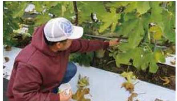
収穫時期はノンストップで稼働しています。

また、いちじくは子どもの頃から身近なもので古いイメージしかありませんでしたが、毎年、県の普及センターを通じて就農希望の研修生を受け入れたり、直売所でも若い人が手に取っていたりと、イメージが変わり