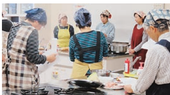
調理法を説明する女性農業委員