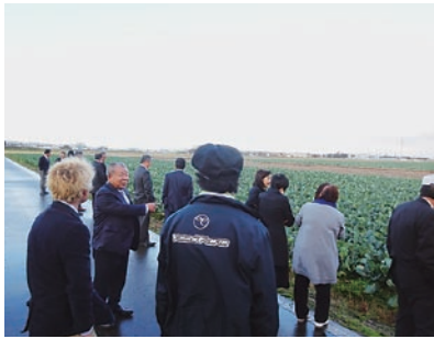
(有)安井ファームのブロッコリー畑

(有)安井ファームは、整備された大区画水田で、水稲収穫後の水田を利用したブロッコリー栽培を実施し、水田のフル活用による複合化の成功例として数多くの賞を受け、一昨年10月には内閣総理大臣賞を受賞している農業法人です。平成13年5月に設立され、当初は水稲経営でしたが、冬場の雇用継続対策として、平成15年に20aでブロッコリーの栽培を始め、現在では71haで年間出荷量440トンを生産し、北陸で最大規模です。石川県では空き農地が無かったため、ブロッコリーの栽培は、水稲収穫後の水田を期間限定で借り受け栽培を拡大してきたことや、今日に至るまでの作型の工夫、越冬技術、品種選定などの試行錯誤の経緯と社員教育や人事評価制度の整備についての説明を受けました。その後耕作地を見学し、広大な耕作地に研修参加者はみな圧倒されていました。