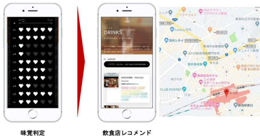
↑ YUMMYSAKE サービスを利用した新潟市内の物販店や飲食店への送客のイメージ図