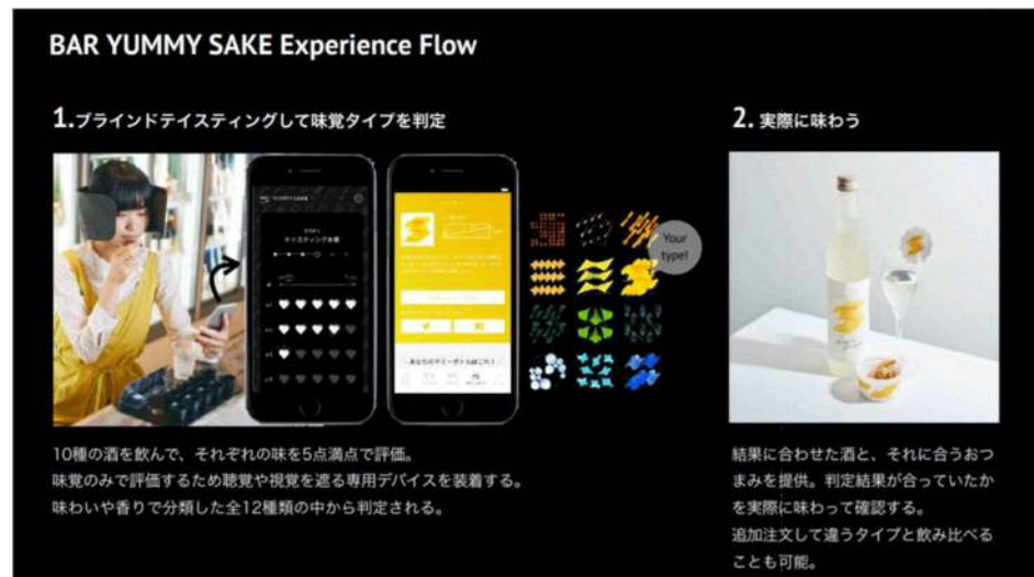
↑ YUMMYSAKE サービスイメージ図

また、その診断結果に付属するサービスとして、フードペアリングや、地域で該当のお酒が飲める店の紹介を行うことで、新潟市内の物販店や飲食店への送客をレコメンドすることが可能。