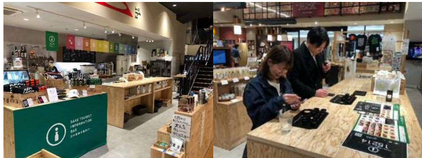
↑左：店内体験スペース 右：実際の体験風景