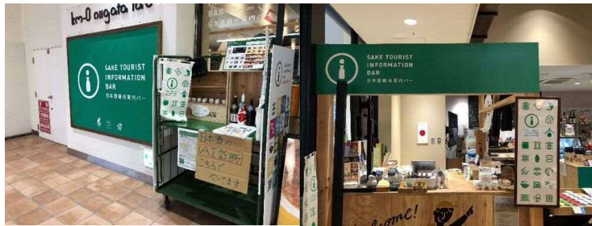
↑左：店舗入り口 右：レジカウンター