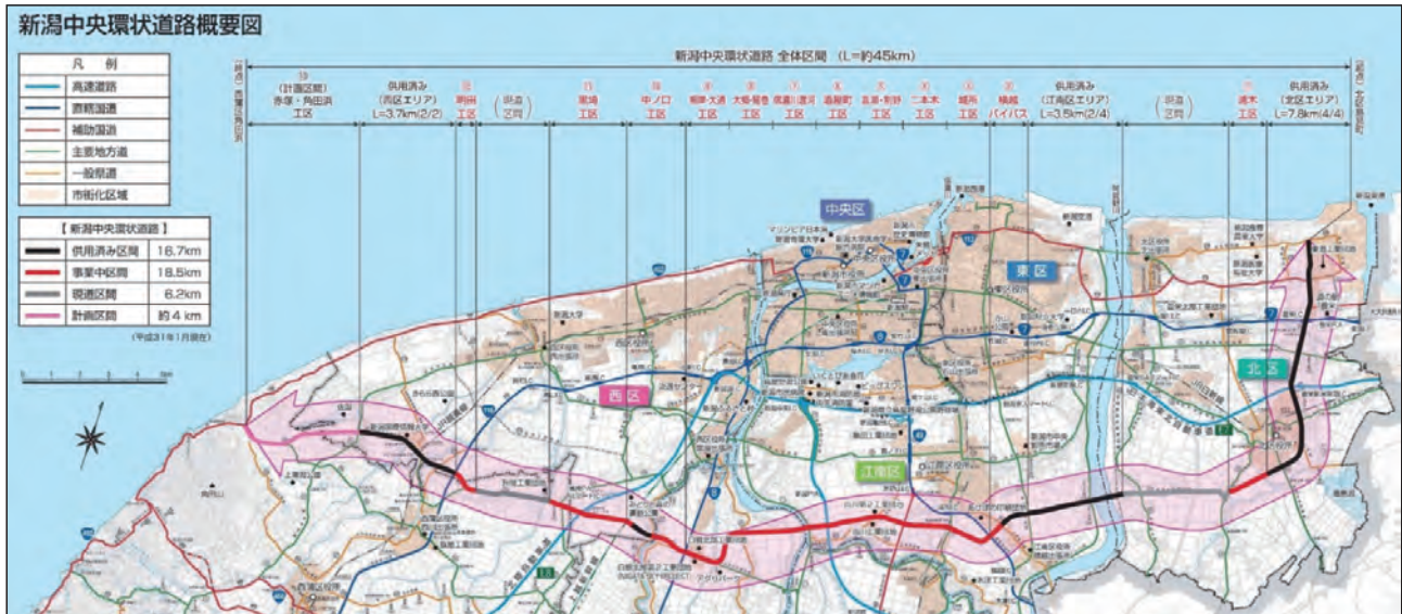
*この地図は、国土地理院発行の5万分の1地形図を縮小したものである

新潟中央環状道路は、多核連携型の都市構造において、市域に放射状に広がる主要幹線道路や高速道路を環状に結び、交流・連携を強化します。