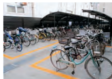
本町通6番町自転車駐車場

これに基づき、車道の左側通行を啓発する自転車走行空間の整備（矢羽根等）や、駐輪場の整備、放置自転車対策、自転車利用ルールの周知を進めていきます。