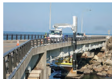
獅子ヶ鼻大橋点検の状況

このため新潟市では、計画的かつ効率的な維持管理の実践に向けて、アセットマネジメントの考え方を取り入れた「新潟市橋梁長寿命化修繕計画」を平成23年3月に作成しました。今後も橋りょうの長寿命化、更新時期の平準化や維持管理費用の縮減など、道路ネットワークの安全性・信頼性確保に努めていきます。