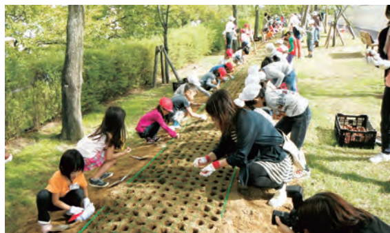
信濃川やすらぎ堤チューリップ植栽