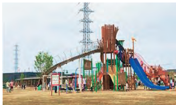
公園整備 (寺山公園)