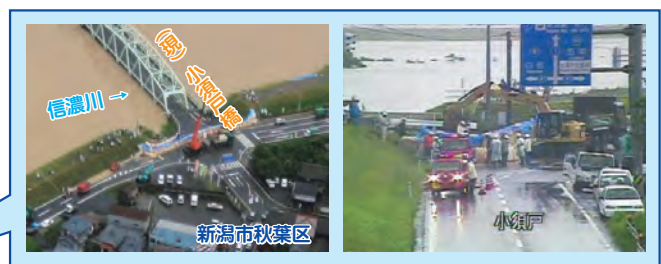
新潟福島豪雨時の出水状況と水防活動 (H23.7.30)