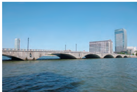
(本市を代表する景観 ばんだいばし しなのがわ)

美しく個性的で魅力あるまちづくりを目指し、優れた景観を「まもり、そだて、つくり、つたえる」ため、景観法に基づく「新潟市景観計画」と「新潟市景観条例」、屋外広告物法に基づく「新潟市屋外広告物条例」を定め、総合的・計画的に景観形成を推進しています。さらに、市内各地域において、それぞれの歴史と文化を活かした「修景」や「きめ細かなルール作り」を市民・事業者と一体となって取り組んでいくことで、市民共通の資産である新潟らしい景観の形成に取り組んでいます。