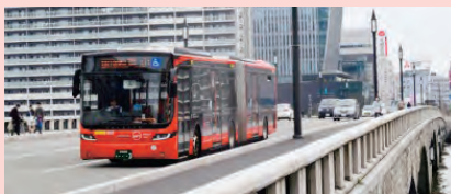
〔連節バス：愛称「ツインくる」〕

新潟駅前～青山間において、連節バス4台と一般バスを組み合わせで運行しています。今後も「基幹公共交通軸」の整備に向け段階的に取り組みます。