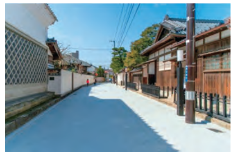
(景観計画特別区域 旧齋藤家別邸周辺地区)