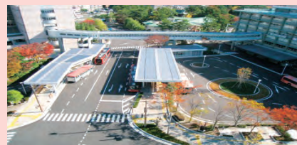
〔市役所ターミナル〕

上屋や防風壁を設置し、移動距離を極力少なくするなど、利用者の負担を軽減しています。