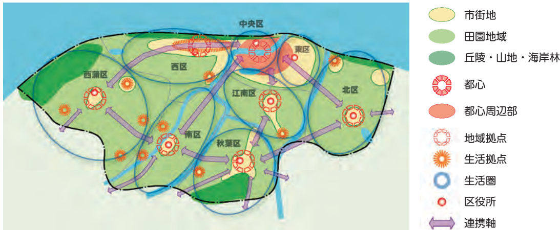
図 都市構造概念図

平成29年3月には、新潟市立地適正化計画を策定し、まちなかに望まれる都市機能や良好な居住環境の形成に向け、適正な土地利用を緩やかに誘導するための取組方針が示されています。