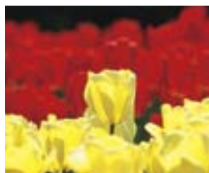
市の花 チューリップ

いつの時代も変わらない新潟の大地を包む雄大な夕日をもとに、大小の赤い月の形はアジア大陸と新潟を、白い扇の形は日本海を表現、マーク全体でアジア大陸の国々をはじめとする海外へ向かう新潟を表しています。