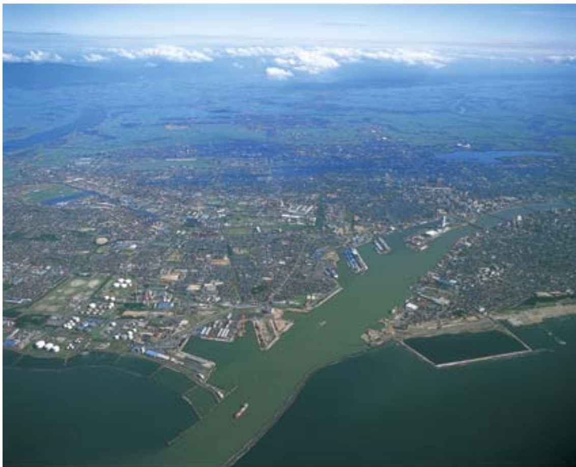
信濃川の河口・港上空から、新潟のまちを一望。