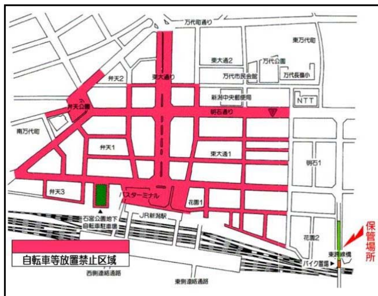
新潟市自転車等放置禁止区域（平成29年4月1日現在）