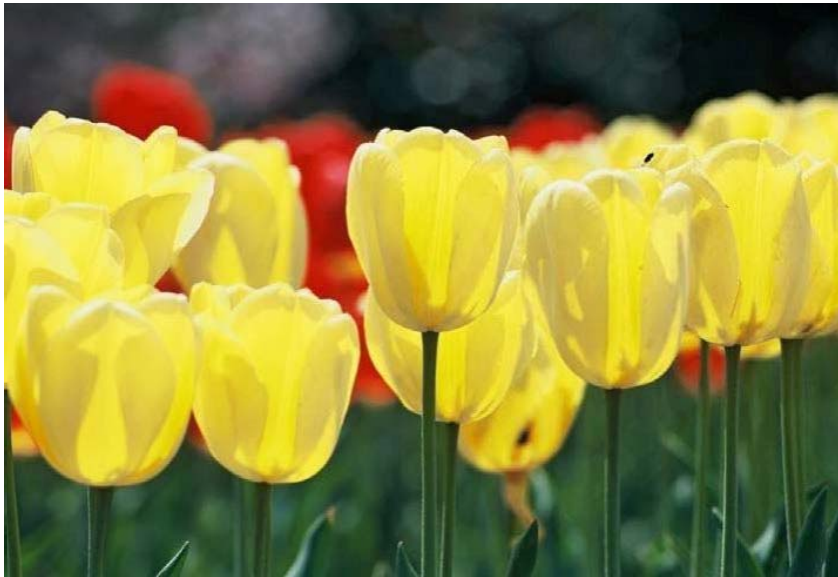
新潟市の花 チューリップ