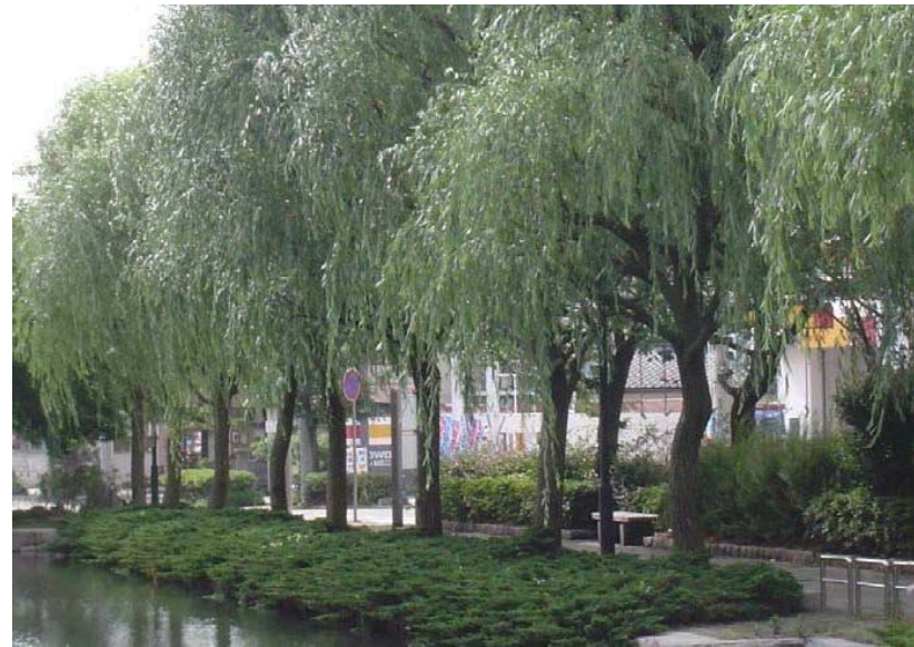
新潟市の木 ヤナギ