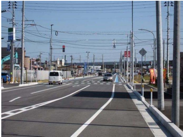
(都)網川原線(女池上山工区)