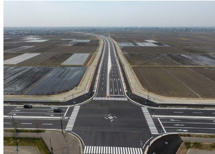
(主)新潟中央環状線(横越バイパス)