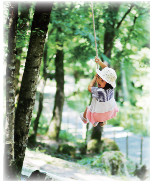
Akihaマウンテンプレーパーク