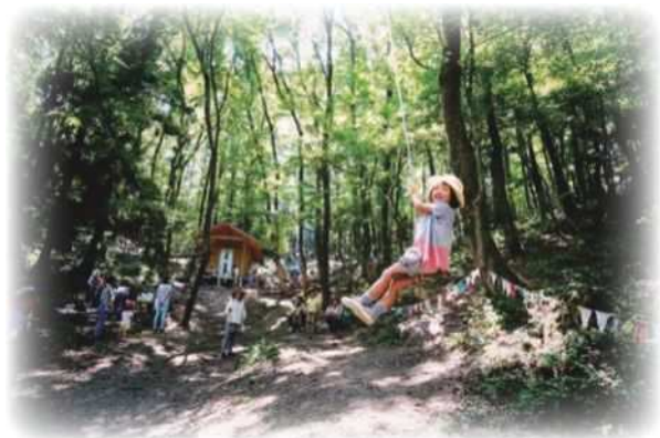
Akihaマウンテンプレーパーク