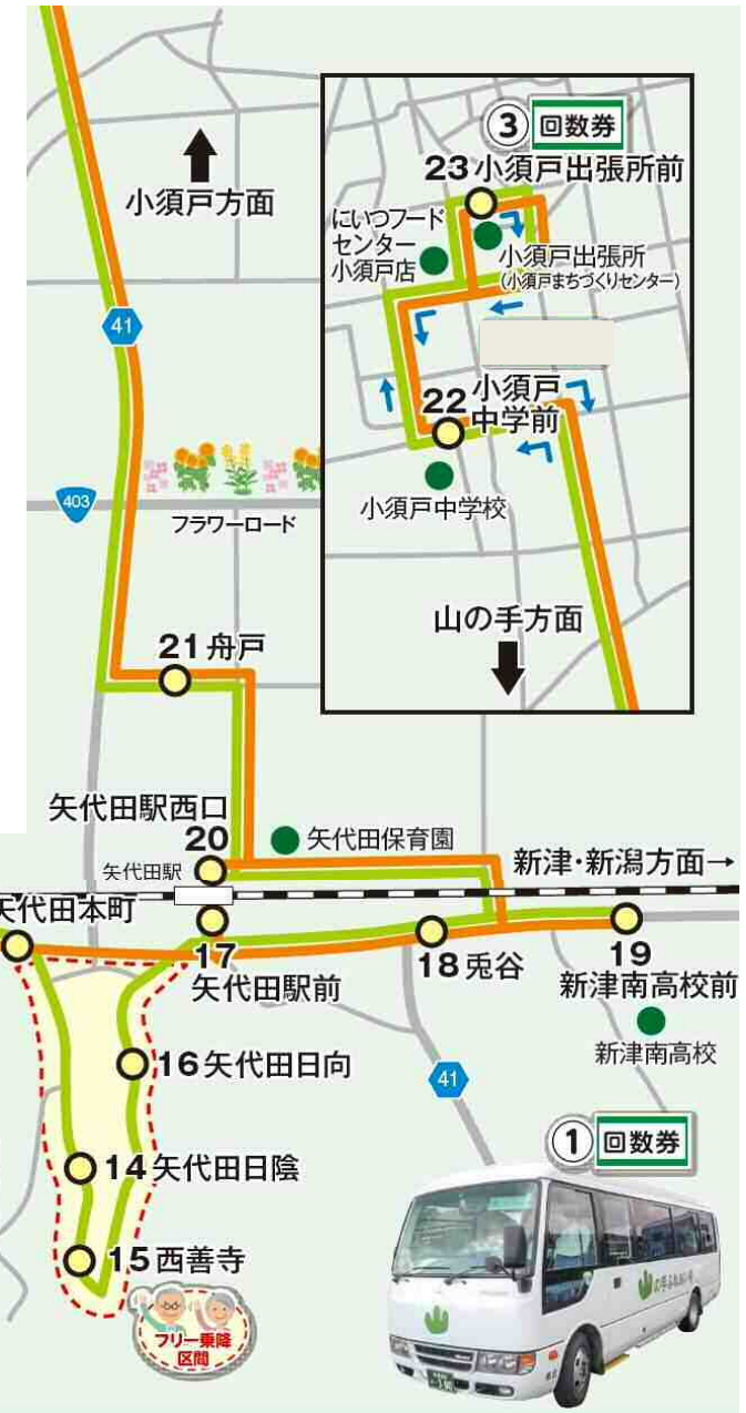
平成30年度版 運行ルート