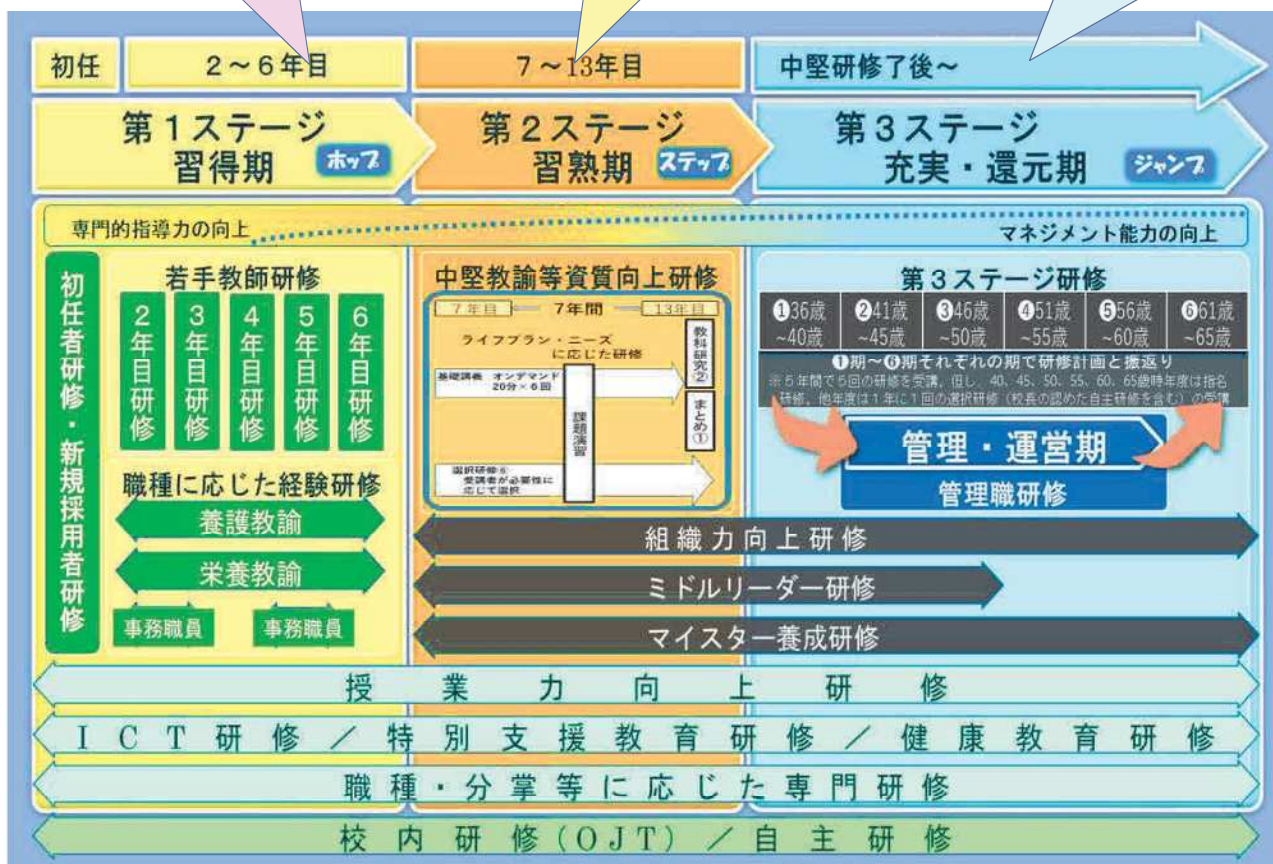
〈新潟市教職員研修体系イメージ図〉

※事務職員は、第3ステージに、副主査・主査【充実期】、主任【還元期】、事務主幹・総括事務主幹【管理・運営期】を、職務によって細分化して位置付けてあります。