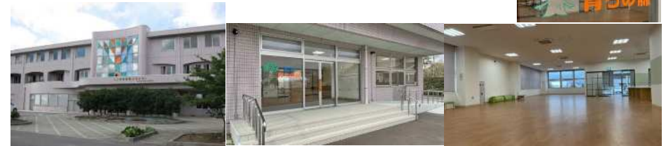
新津健康センター館内図 (R4.4.1から)