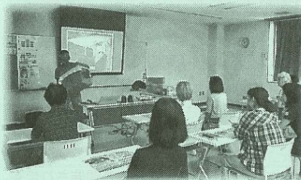
7月29日 サイチヨのマジックダンボール講座